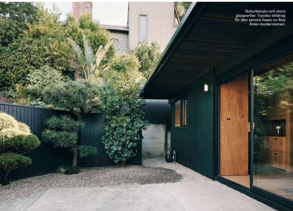
Naturkänsla och stora glaspartier. Typiska stildrag för den senare fasen av Bay Area-modernismen.

så mycket som möjligt om platsen innan vi påbörjar ett projekt.